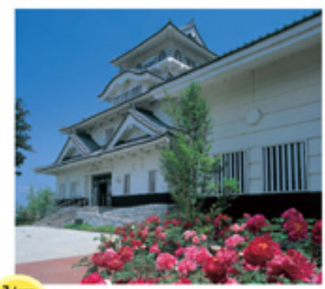
1km 5分 1 歌舞伎文化公園 (市川三郷町) 【お問い合わせ先】TEL:055(272)5500

みたまの湯の周辺には山梨を楽しめる観光スポットがいっぱい。ぜひ、立ち寄ってみては？ 市川三郷町内(みたまの湯周辺)観光スポット