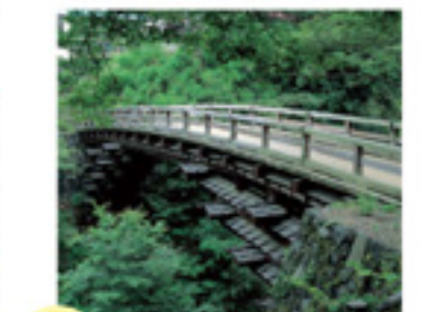
50km 60分 15 名勝猿橋 (大月市) 【お問い合わせ先】TEL:0554(22)2111 大月市観光協会