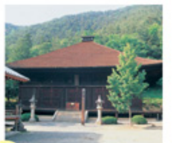
27km 40分 9 大善寺本堂 (甲府市) 【お問い合わせ先】TEL:0553(44)0027