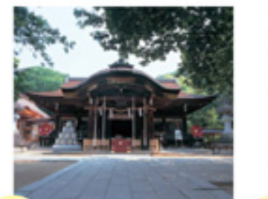
18km 40分 8 武田神社 (甲府市) 【お問い合わせ先】TEL:055(252)2609