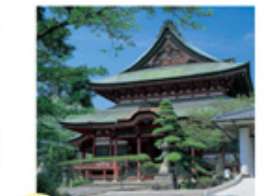
18km 36分 7 甲斐善光寺 (甲府市) 【お問い合わせ先】TEL:055(233)7570