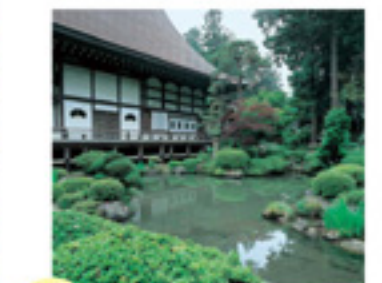
29km 40分 11 恵林寺 (甲府市) 【お問い合わせ先】TEL:0553(33)3011