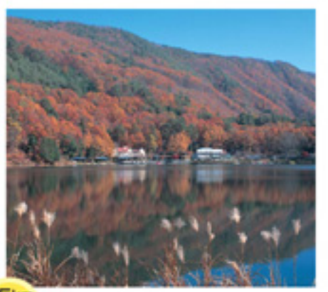
15km 40分 3 四尾連湖 (市川三郷町) 【お問い合わせ先】TEL:055(272)1101 市川三郷町役場

大門碑林公園は甲斐源氏発祥の地です。人と自然、歴史と文化、人と人とのふれあいの場として、書道のまちづくりの中核をなす公園です。公園の中心は、中国で最も著名な陝西省の西安碑林と山東省の曲阜碑林の名碑です。