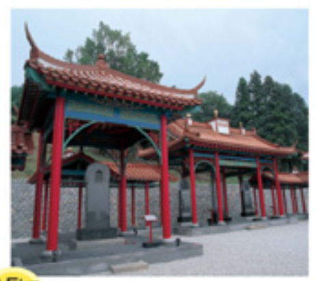
3.5km 10分 2 大門碑林公園 (市川三郷町) 【お問い合わせ先】TEL:055(272)7100

初代市川團十郎ゆかりの地として、注目を集める歌舞伎文化の拠点です。敷地内には文化資料館やふるさと会館、いこいの森やふれあい広場があり、展示物を鑑賞したり散歩をしながら、ゆっくりと歌舞伎文化にふれることができます。