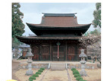
27km 40分 10 清白寺仏殿 (山梨市) 【お問い合わせ先】TEL:0553(22)0829