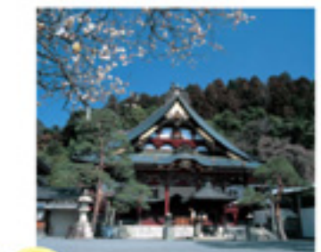
35km 50分 14 身延山久遠寺 (身延町) 【お問い合わせ先】TEL:0556(82)1011