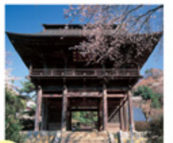
33km 45分 13 天童山景徳院 (甲府市) 【お問い合わせ先】TEL:0553(48)2225